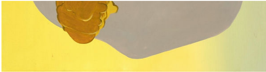
Maja Rohwetter, Hot Standby , oil on canvas, 100 x 80 cm, 2019

M.B. Wie entwickelst Du bereits ‚bestehende‘ Bildmotive zu neuen Werken weiter? Arbeitest Du in Serien, oder kann man sie vielleicht als eine Art work in progress bezeichnen, oder als einen quasi performativen Akt, der den digitalisierten Zwischenstand eines Motivs aufgreift, der Dich neu inspiriert?