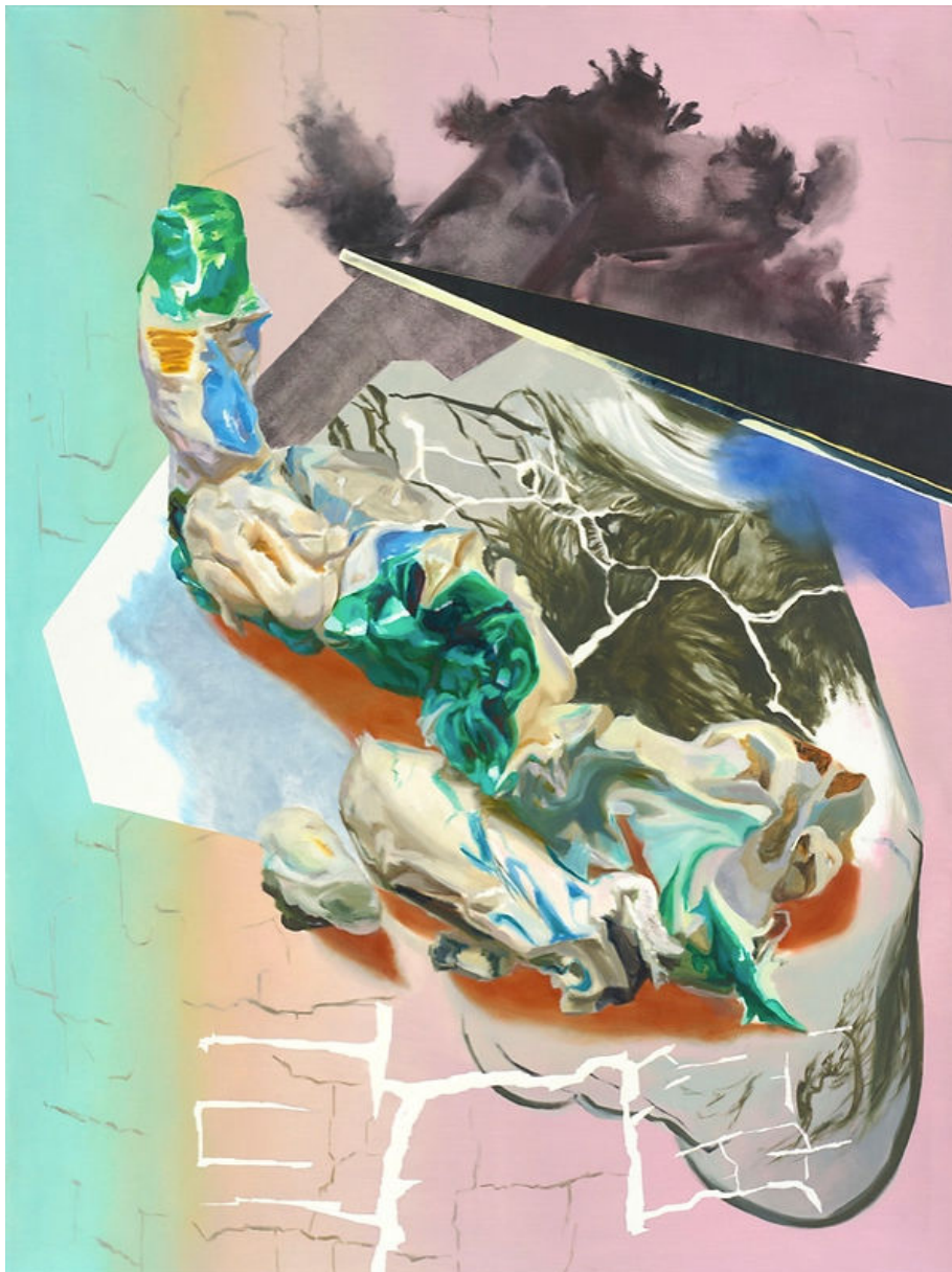
Maja Rohwetter, Pending Elevation , oil on canvas, 160 x 120 cm, 2019

Malerei ist in ihrer Langsamkeit fast das Gegenteil davon, ist Materialisierung. Ich mag das Handwerkliche und Kontemplative daran und den Eigenwillen des Materials, das was sich eben nicht digitalisieren lässt.